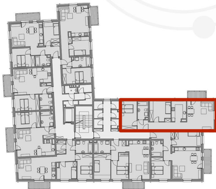
RZUTY KONDYGNACJI: PIĘTRO I