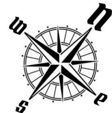
USYTUOWANIE OGRÓDKÓW I MIEJSC POSTOJOWYCH