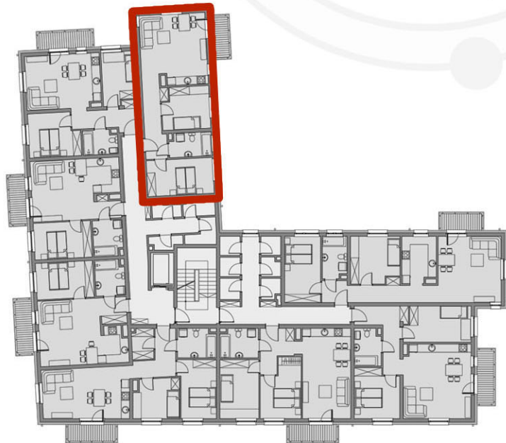
RZUTY KONDYGNACJI: PIĘTRO II