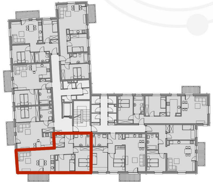
RZUTY KONDYGNACJI: PIĘTRO II