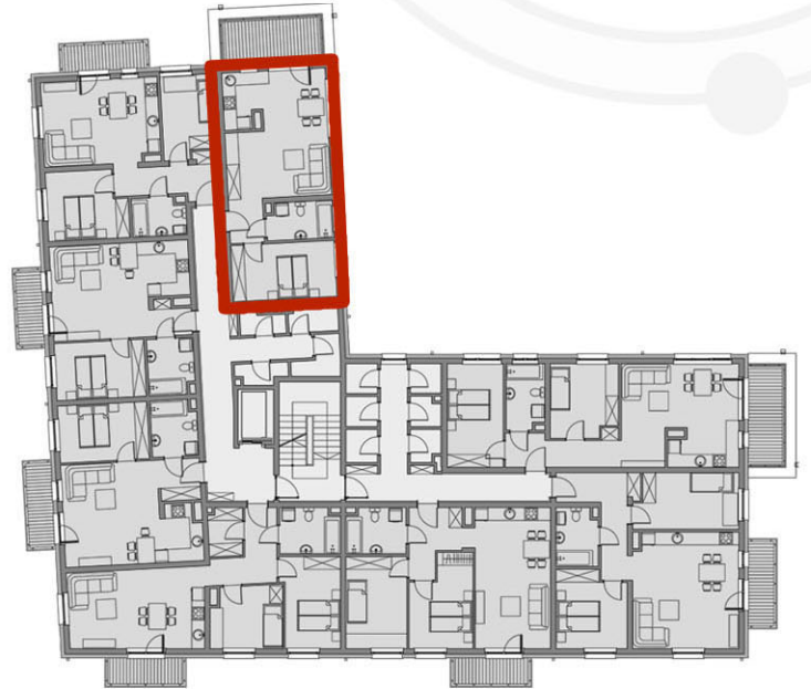
RZUTY KONDYGNACJI: PIĘTRO III