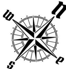
USYTUOWANIE OGRÓDKÓW I MIEJSC POSTOJOWYCH