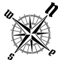
USYTUOWANIE OGRÓDKÓW I MIEJSC POSTOJOWYCH