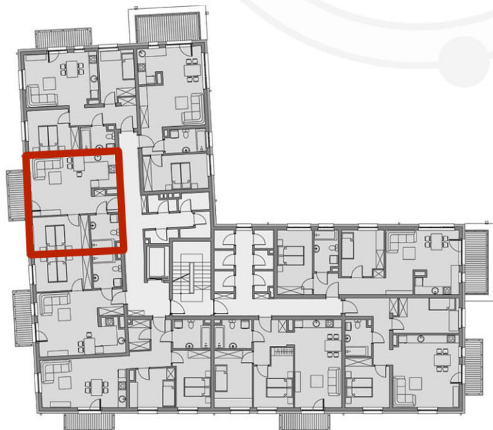
RZUTY KONDYGNACJI: PIĘTRO III