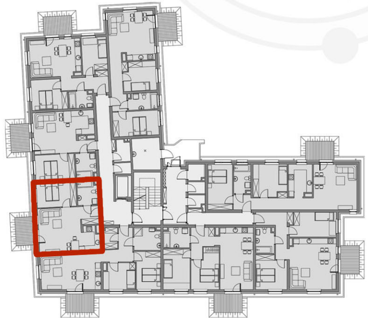
RZUTY KONDYGNACJI: PARTER